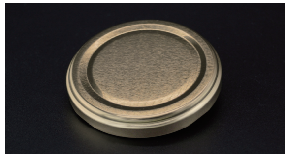
RTS-D ( Stepped Regular Twist Off Cap )