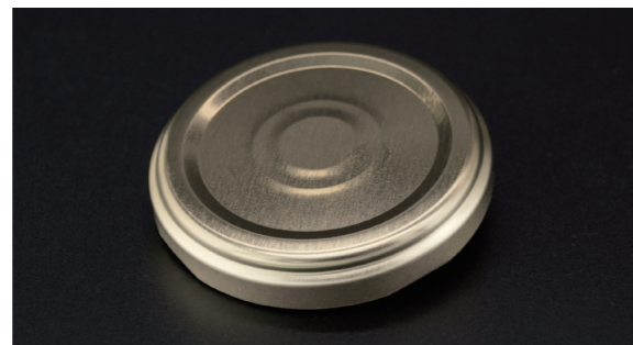
RSB ( Stepped Regular Twist Off With Button )

RTS-Dの天面に凸起(セーフティボタン)を設け、充填後凹んだボタンが開栓で跳ね上がるTE性を持たせたタイプです。